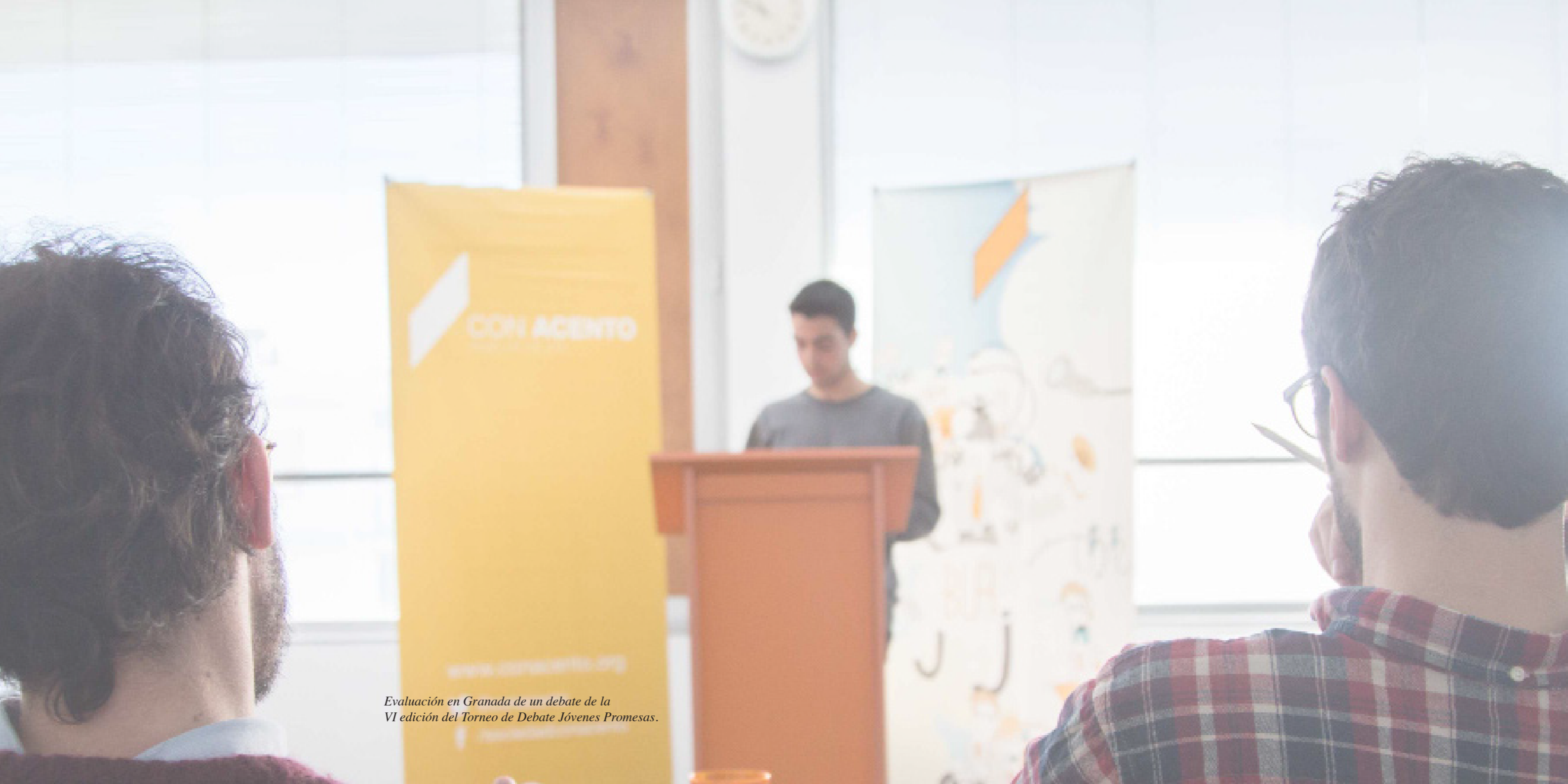
Evaluación en Granada de un debate de la VI edición del Torneo de Debate Jóvenes Promesas.